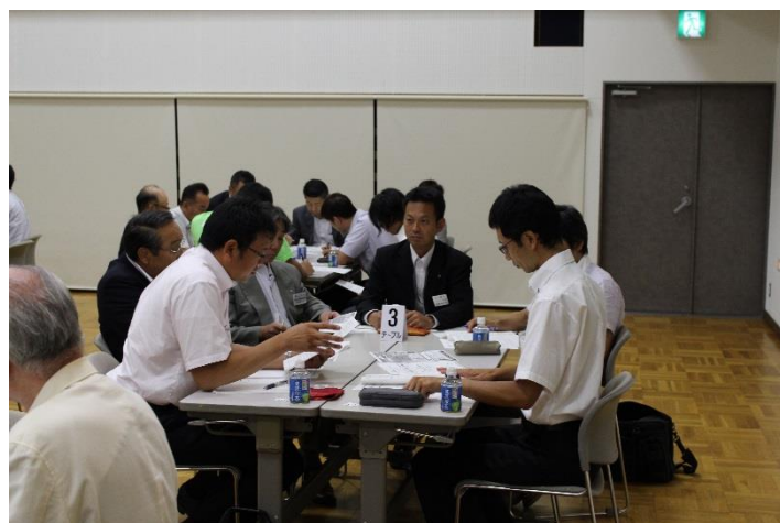
バズセッションの様子