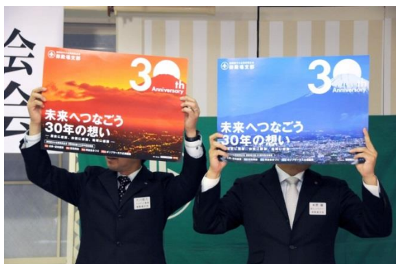
支部設立30周年イメージポスターの発表