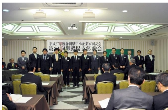
平成27年度 役員の皆さん