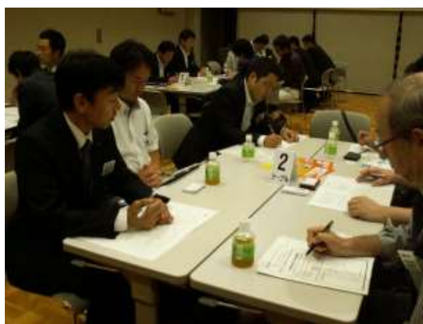
<バズセッションの様子>