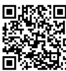
御殿場支部メンバーからのメッセージです。Youtubeで動画が再生されますので是非ご覧ください